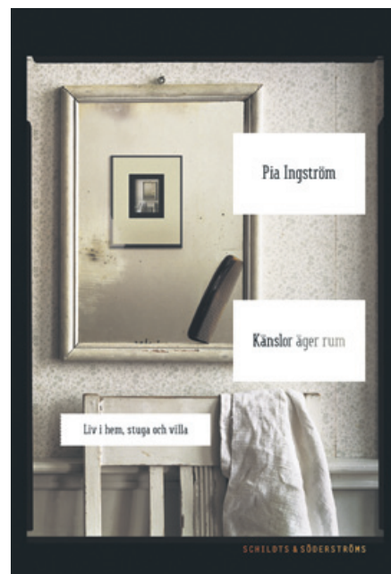
Pia Ingström: Känslor äger rum – Liv i hem, stuga och villa. Schildts & Söderströms, 2014.