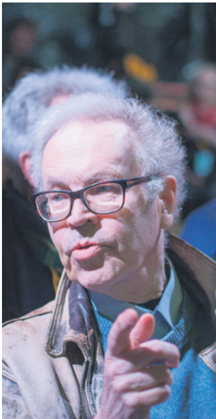
Peter von Bagh under visningen av hans nya film Sosialismi på Midnight sun festival i Sodankylä för en vecka sedan.

SOSIALISMI heter en ny film av Peter von Bagh , en av Finlands mest framstående filmhistoriker och den bärande samt mest ikoniska kraften bakom filmfestivalen i Sodankylä. Därför var det naturligt att filmen också hade förhandsvisning på årets upplaga av festivalen.